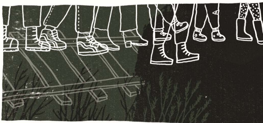
Ena Jurov 2020.

Smrti na migrantskom putu kroz Hrvatsku tragičan su ishod raskoraka između isključujućih migracijskih politika i potreba ljudi da migriraju. Obespravljani i kriminalizirani, državljanima tzv. trećih zemalja koji ne prihvaćaju život u odlagalištima ljudi koje je u zemljama u susjedstvu Hrvatske izgradila Europska unija, prisiljeni su na potajne ulaske u Hrvatsku i skrivanje na njezinom teritoriju. Pod cijenu "umiranja da bi se živjelo" oni prolaze kroz minska polja, planinska i šumska područja te preko rijeka koje danas već rutinski odnose njihove živote. O njihovim se smrtima u javnosti rijetko govori, o njima ne postoji ni relevantna službena statistika, no to ne može poništiti tragičnu činjenicu da se smrti na granicama i u ime granica događaju gotovo svakodnevno.